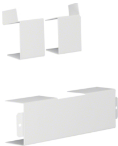
Té LFS40060 RAL 9010