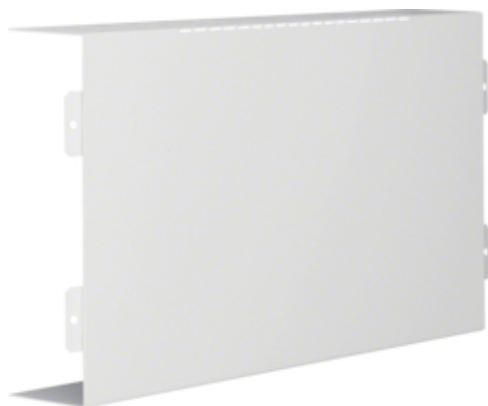
LFS, T-stuk voor goot 60x200 mm, helderwit